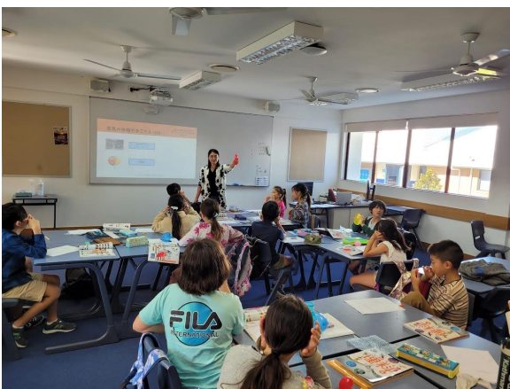
みんな大好き理科学習日。 身近にあるもので楽しく理科を学びました。

Facebook で 学校の様子などを 随時配信しております。 ぜひご覧下さい。