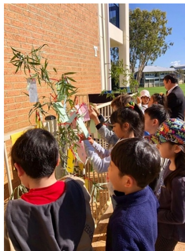
七夕集会 みんなでお願い事を 笹に飾りました。

Facebook で 学校の様子などを 随時配信しております。 ぜひご覧下さい。