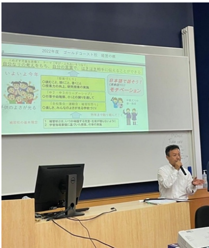
保護者会総会 雨が続いてお足元の悪い中 お起しいいただきありがとうございました。