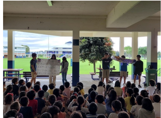
子供の日集会 こいのぼりの歌をみんなで歌いました。