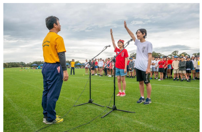
待ちに待った運動会。どの競技もみんな一生懸命に取り組み 笑顔もいっぱいでした。