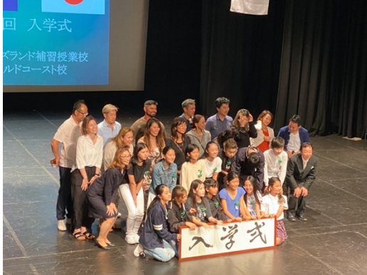
第29回入学式 幼稚部23名、小1 47名、 中1 14名、全校生徒249名のスタートとなりました。