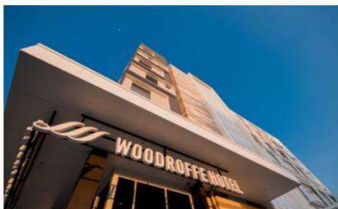
Woodroffe Hotel Gold Coast