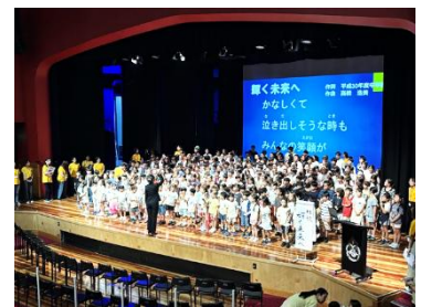
【補習校祭り全校合唱の様子】

それでは、これから長いホリデーに入ります。事故なく元気に楽しいホリデーをお過ごしください。様々な体験を通して、ひと回り成長した子供たちと4学期に再会できることを、楽しみにしております。