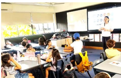
日本のお金のお勉強(幼稚部)