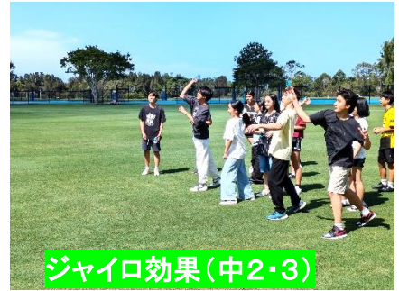
ジャイロ効果(中2・3)