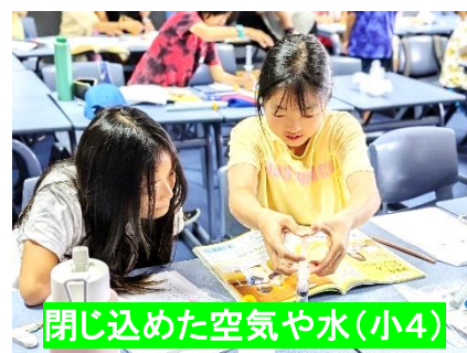
閉じ込めた空気や水(小4)