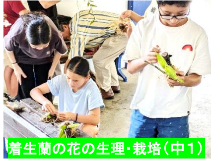
着生蘭の花の生理・栽培(中1)