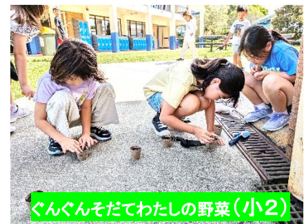
ぐんぐんそだてわたしの野菜(小2)